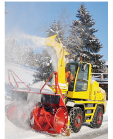
Le canton a besoin de véhicules neufs.

Le crédit demandé permettra de remplacer neuf véhicules et machines. ● RÉD - COMM