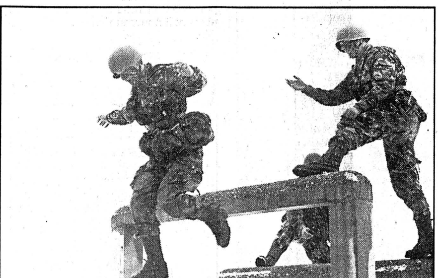
DÉMONSTRATION — Du rythme et du souffle sur la piste d'obstacles.

Les plus émues étaient bien sûr les mamans, tandis que les papas, eux, étaient fiers de voir leur rejeton, se rappelant ainsi les bons moments passés sous les drapeaux. Des souvenirs évoqués lors du repas pris en commun à la caserne. /hv