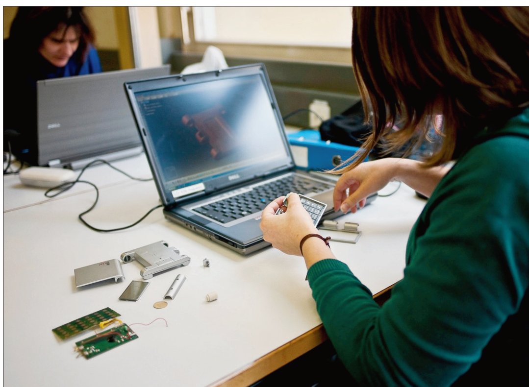
LE LOCLE La Haute Ecole Arc ingénierie ouvrira ses portes au public samedi.